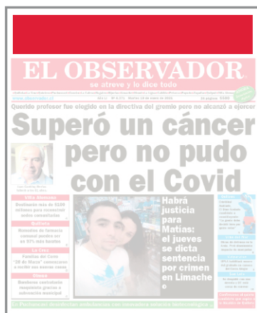
HUINCHA EN PORTADA