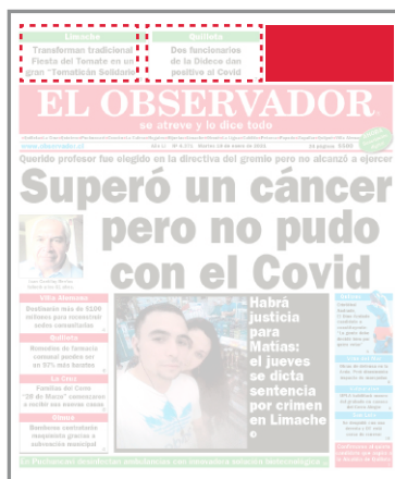
CALUGAS SUPERIOR EN PORTADA