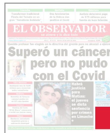
CALUGA INFERIOR EN PORTADA